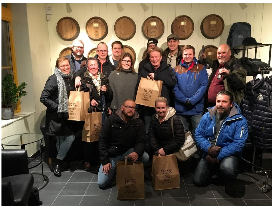
Nu undrar ni kanske vad det är i påsarna? Ja inte är det whisky!