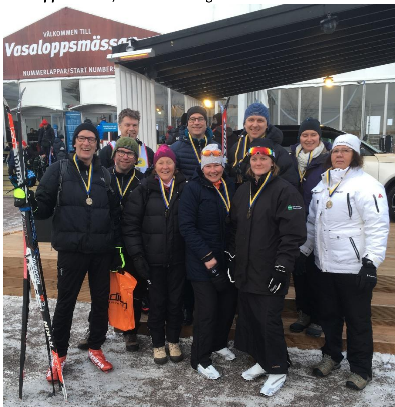
Här är hela gänget som åkte Stafettvasan.