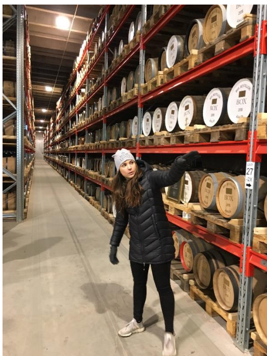
Jätteduktig guide på runturen

Efter en guidad visning i själva fabriken var det dags för själva provningen. Fem olika sorter provades och bedömdes. När det var dags för summering tyckte ungefär hälften att de rökiga sorterna var godast och några höll på den som smakade lite sherry. Här insåg man verkligen att smaken är som baken.