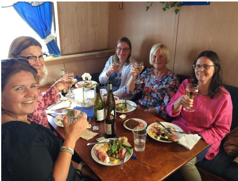
Ett gäng glada tjejer på båtresa med Ådalen III.

I midsommarveckan anordnades den traditionella båtresan med Ådalen III. 41 medlemmar njöt av vackert väder och god mat!