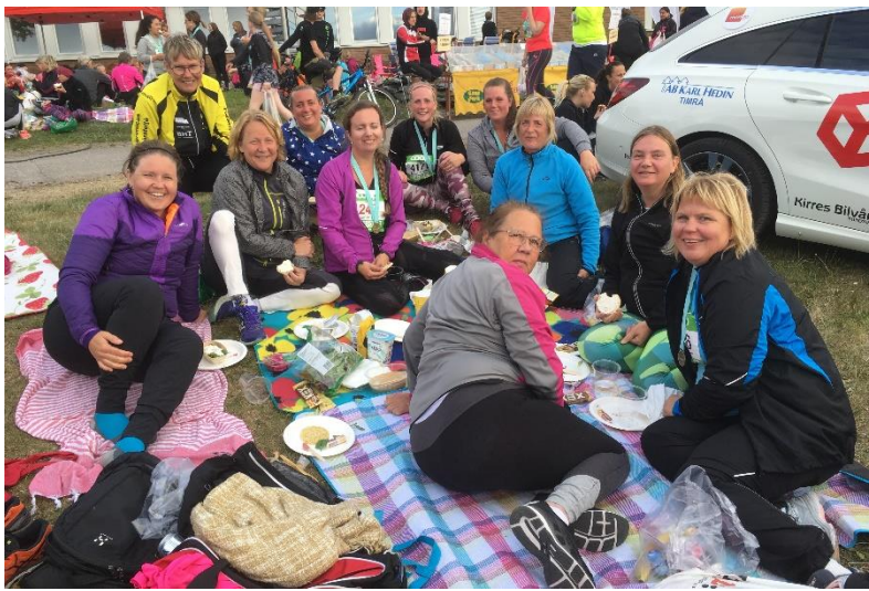
Vårruset 2018 – Tjejerna har picknick i det gröna efter loppet.