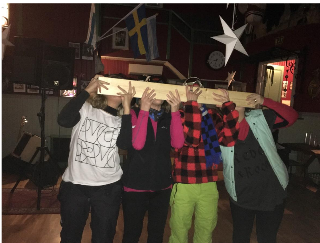
Jäger på planka var mycket populärt men söligt!